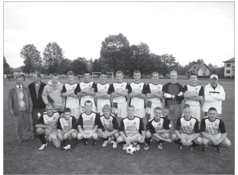
Grom Różaniec – lider I grupy A-klasy po jesiennej rundzie rozgrywek.