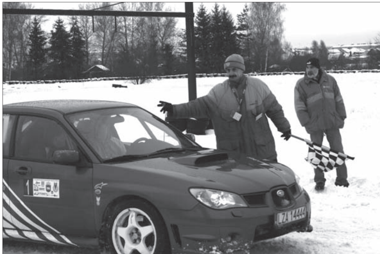
► Następne zawody będą już o punkty.

Jak zapewniają organizatorzy to pierwsze, ale nie ostateczne tego typu przedsięwzięcie. Na tor RCEZ przy ul. Motorowej, przyjechało wielu (głównie młodych) kierowców, którzy „ścigali się”, po torze nie dla swojej chwały, ale głównie po, to by solidarnie wesprzeć akcję Jurka Owsiaka. Pieniądze zebrane z deklarowanych wpłat z tzw. „wpisowego”, zostały przekazane do powiatowego sztabu WOŚP w BCK. W zawodach wzięło udział 31 kierowców, pochodzących z naszego powiatu, ale także z odleglejszych miejscowości takich jak: Tomaszów Lubelski, Stalowa Wola czy Zamość. Nie zabrakło też pań, ale pewnie ze względu na bardzo trudne warunki panujące na torze, tym razem tylko asystowały dzielnie panom, jako pilotki na fotelu pasażera. Tak jak wcześniej zapowiedzieli organizatorzy, w tej otwartej formule zawodów nie liczyły się wyniki czy styl jazdy po torze, lecz sam start w imprezie. Dla najlepszych kierowców w klasach (4) były puchary ufundowane przez UKS Moto-Kart „Energetyk”, a dla wszystkich uczestników przygotowane oryginalne, pamiątkowe dyplomy z logo orkiestry WOŚP, które wręczyli: pre-