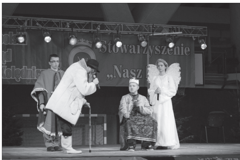
II miejsce na ogólnopolskim przeglądzie to duży sukces gorajskiej grupy.