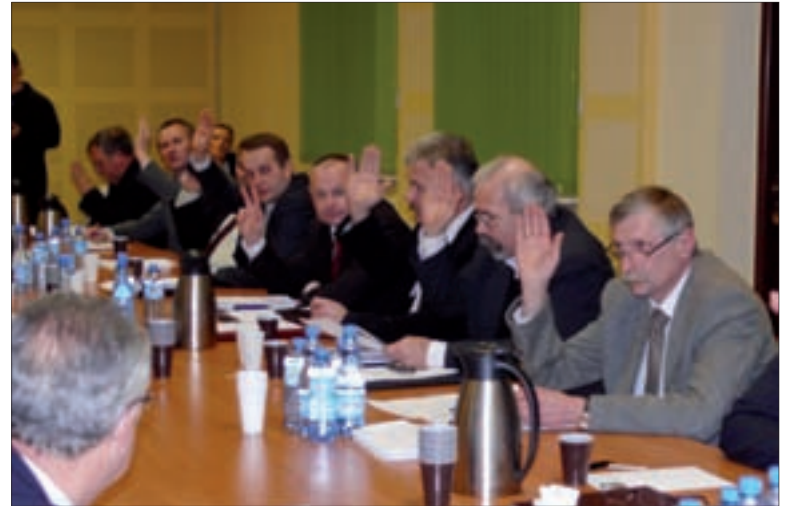
16 radnych poparło budżet na 2010 r.