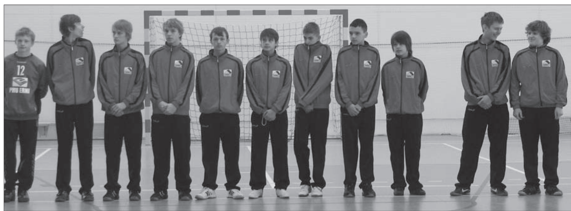
Drużyna MKS Biłgoraj zajęła trzecie miejsce w turnieju

Szczypiornicy MKS-u Biłgoraj zajęli trzecie miejsce, w rozgrywanym po raz szósty w Biłgoraju, Memoriale Bogdana Ogonowskiego. Zwycięzcą turnieju została Kadra I Województwa Lubelskiego, która w finale pokonała Kadre II Województwa.