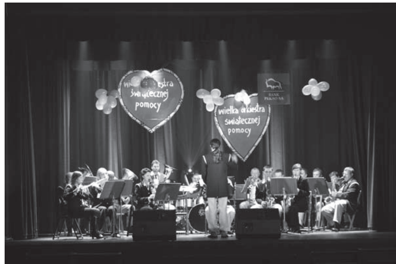
► Finałowy koncert odbył się w Biłgorajskim Centrum Kultury.