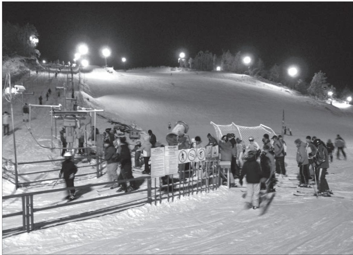
Miłośnicy nart mogą poszusować również na Lubelszczyźnie.

Został uruchomiony w sezonie zimowym 2006/2007. Góra, na której znajduje się kompleks ma 68 metrów różnicy poziomów, jest skierowana na północ, posiada dość ostre nachylenie. Wyposażona jest w 4 wyciągi i 5 tras o długości: 200, 420, 480, 500 i 650 metrów. Dla początkujących dostępna jest osła łączka o długości 80 metrów. W budowie jest snowpark i halfpipe. Stok jest sztucznie naśnieżany, ratrakowany i całkowicie oświetlony. Funkcjonuje tam wypożyczalnia sprzętu. Obowiązuje zakaz używania sanek. Cennik przedstawia się następująco: Wyciąg duży w dni powszednie 1,50 zł - 1 wjazd, w weekendy i święta 2,50 zł - jeden wjazd. Wyciąg średni 1zł - jeden wjazd w weekendy i święta 1,50 zł. Karnety czasowe 1 godz. w dni powszednie 12 zł, w weekendy 17 zł. Kolejny - 3 godziny w dni powszednie 30 zł + bonus w weekend i święta 40 zł za 3 godz. Karnet całodzienny 70 zł. Wyciąg na osłej łączce w dni powszednie 7 zł za