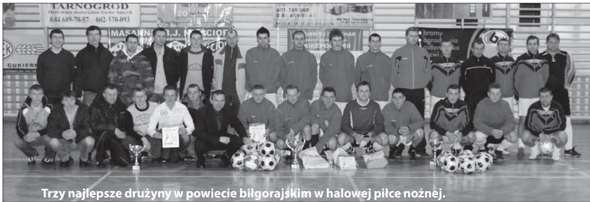
Trzy najlepsze drużyny w powiecie biłgorajskim w halowej piłce nożnej.

Piłkarze Gromu Różaniec potwierdzili dobrą formę prezentowaną w rundzie jesiennej rozgrywek A-klasy. W finale turnieju o Puchar Starosty Biłgorajskiego w rzutach karnych pokonali Olimpiakos Tarnogród i wraz z drugim finalistą będą reprezentować Powiat Biłgorajski w Finale Okręgowym ZOZPN.