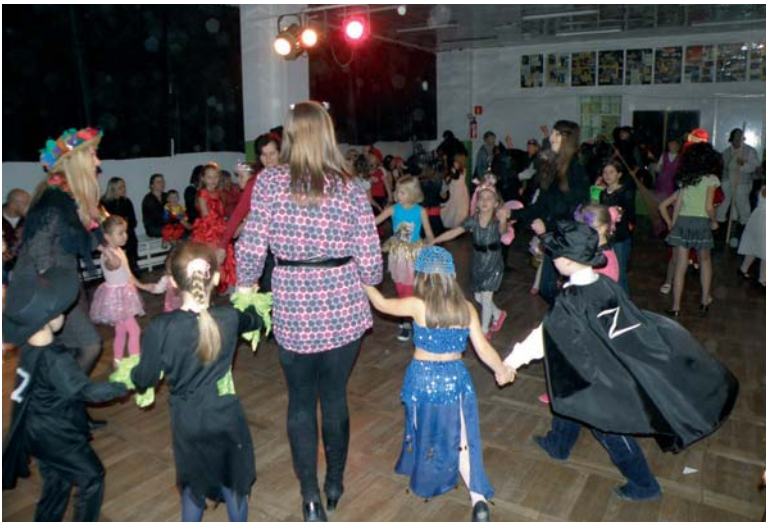
Bal przebierańców już tradycyjnie organizowany jest przez MDK w okresie karnawału.

W środowy wieczór, 27 stycznia, w Młodzieżowym Domu Kultury w Biłgoraju na balu przebierańców bawili się najmłodszy wychowankowie wraz z nauczycielami.