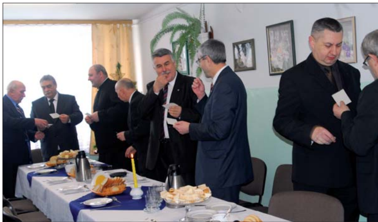
Najpierw wspólna modlitwa, a potem łamanie się białym symbolem pokoju.

W ostatnią niedzielę stycznia na spotkaniu opłatkowym zebrał się członkowie i sympatycy Prawa i Sprawiedliwości. Tradycyjnie już rozpoczęło się ono mszą św. odprawioną w kościele WNMP.