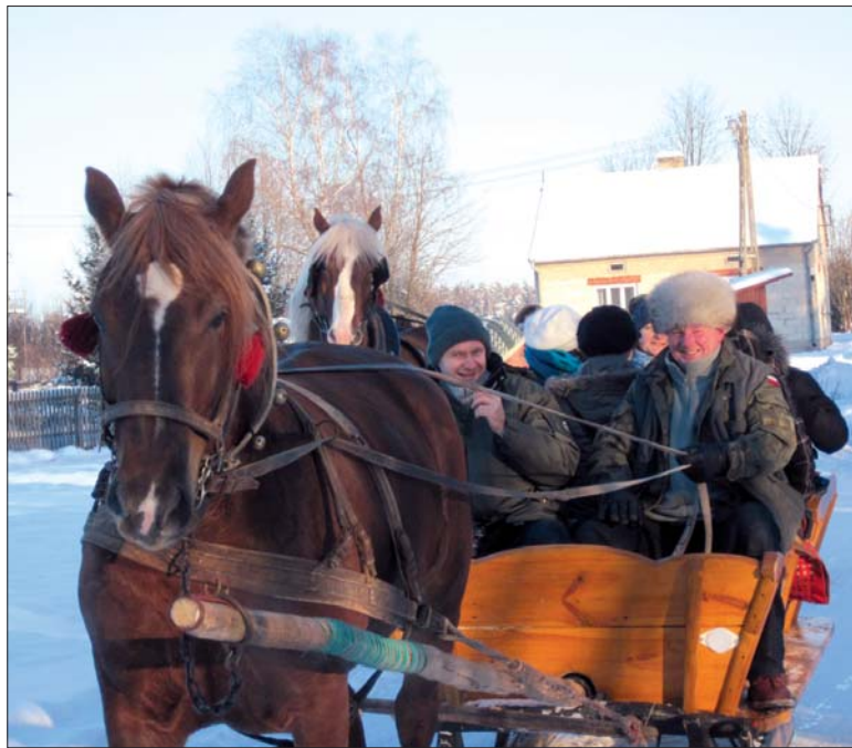
Kuligi to jedna z większych zimowych atrakcji powiatu biłgorajskiego.