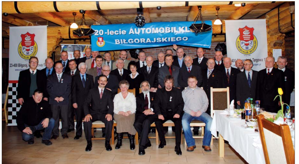
Pamiątkowe zdjęcie z okazji okrągłego jubileuszu.

Automobilklub Biłgorajski będący Członkiem Rzeczywistym Polskiego Związku Motorowego (PZM), powstał 30 listopada 1989 roku, a 19 grudnia 1989 r. został wpisany do