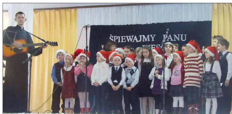
Zespół wokalny ze szkoły podstawowej w Bukownie.

W niedzielę, 31 stycznia, w Gminnym Ośrodku Kultury w Biszczu odbył się Powiatowy Przegląd Kolęd i Pastorałek. Do udziału w konkursie zgłosiło się 7 zespołów. Wśród występujących znaleźli się zarówno młodzi, jak i starsi wykonawcy.