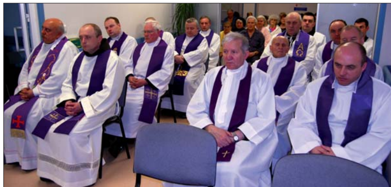
Podczas spotkania odprawiona została msza św. w intencji tych, którzy tworzyli historię szpitala, obecnie pracujących oraz chorych.

Pod koniec lutego w biłgorajskim szpitalu odbył się zjazd kapelanów szpitali i domów opieki społecznej z terenu Diecezji Zamojsko-Lubaczowskiej. Dotychczasowe zjazdy kapelanów szpitalnych, nawiązujące do Światowego Dnia Chorych, odbyły się w Zamościu i Tomaszowie Lubelskim. Zaplanowane jest już kolejne spotkanie, które w przyszłym roku odbędzie się w Lubczowie.