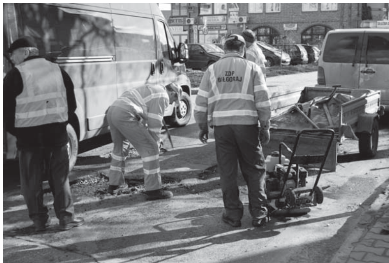
► Wiosenne remonty realizowane są tam, gdzie pozwala na to pogoda.

Aby zapobiec utrudnieniom już przy każdych sprzyjających warunkach pogodowych ZDP likwiduje najgłębsze ubytki przy użyciu masy mineralno – asfaltowej technologią „na zimno”. Na likwidację płytszych ubytków w jezdni nie pozwalają