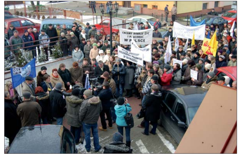
Pracownicy szpitala protestowali przed budynkiem starostwa w czwartkowe przedpołudnie.

Przedstawiciele Zarządu Powiatu w osobach starosty i wicestarosty stwierdzili, iż nie jest możliwe poręczenie kolejnego kredytu dla szpitala z powodu braku możliwości finansowych Powiatu, nie można wstrzymać procedury przetargowej. Stwierdzili także, że nie negują celowości utworzenia spółki pracowniczej. Nie sprzeciwili się również w stosunku do planów pozyskania środków z RPO, jednak przy zapewnieniu wkładu finansowego ze środków szpitala. Natomiast jeżeli chodzi o stanowisko dyrektora – to jego powołanie i odwołanie jest w kompetencji całego