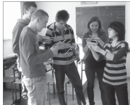
► Chińsko-gruzińska wizyta w ZSZiO była okazją do bezpośredniego zetknięcia się biłgorajskich uczniów z innymi kulturami

Zespół Szkół Zawodowych i Ogólnokształcących w Biłgoraju gościł, już po raz czwarty, wolontariuszy międzynarodowej organizacji studenckiej AIESEC realizującej międzykulturowy projekt PEACE Cross-cultural Understanding. Wolontariusze przebywali w Biłgoraju od 7 do 14 marca 2010 r.