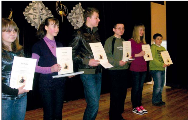
Zwycięzcy konkursu chopinowskiego.

Gminny Ośrodek Kultury w Łukowej 6 marca był gospodarzem imprezy „Łukowska Babosiada”. W tym roku ze względu na przypadającą 200 rocznicę urodzin Fryderyka Chopina spotkanie połączono ze świętem „poety fortepianu”.