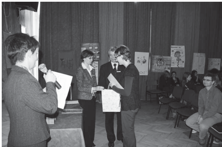
► Apel podsumowujący oraz wręczenie wyróżnień.

W konkursie „Twoje zdjęcie w Internecie - szansą dla Ciebie czy zagrożeniem?” wzięli udział uczniowie z 9 szkół ponadgimnazjalnych i 26 gimnazjów powiatu biłgorajskiego. Łącznie prezentacje multimedialne przygotowało 62 uczniów, z czego do ścisłego finału zakwalifikowano 14 prac. Jury oceniające prezentacje