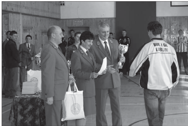
Uroczyste wręczenie pucharów.

żyny – Biłgoraj, Chełm, Tomaszów i Rozwadów do nich rozlosowane zostały pozostałe zespoły.