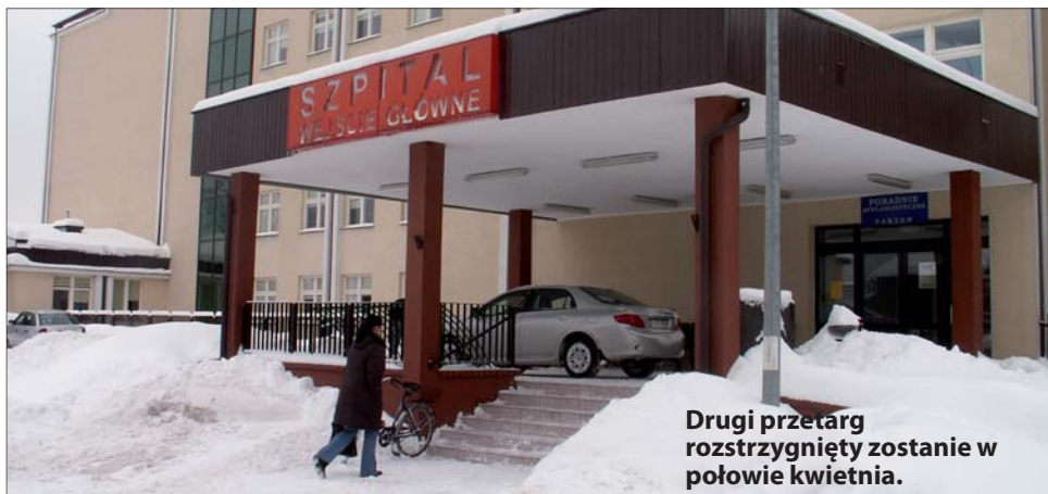
Drugi przetarg rozstrzygnięty zostanie w połowie kwietnia.

Zarząd Powiatu w Biłgoraju w uzgodnieniu z Dyrektorem Samodzielnego Publicznego Zespołu Opieki Zdrowotnej w Biłgoraju ogłosił drugi przetarg pisemny nieograniczony na dzierżawę nieruchomości oraz sprzętu medycznego i wyposażenia SP ZOZ w Biłgoraju.