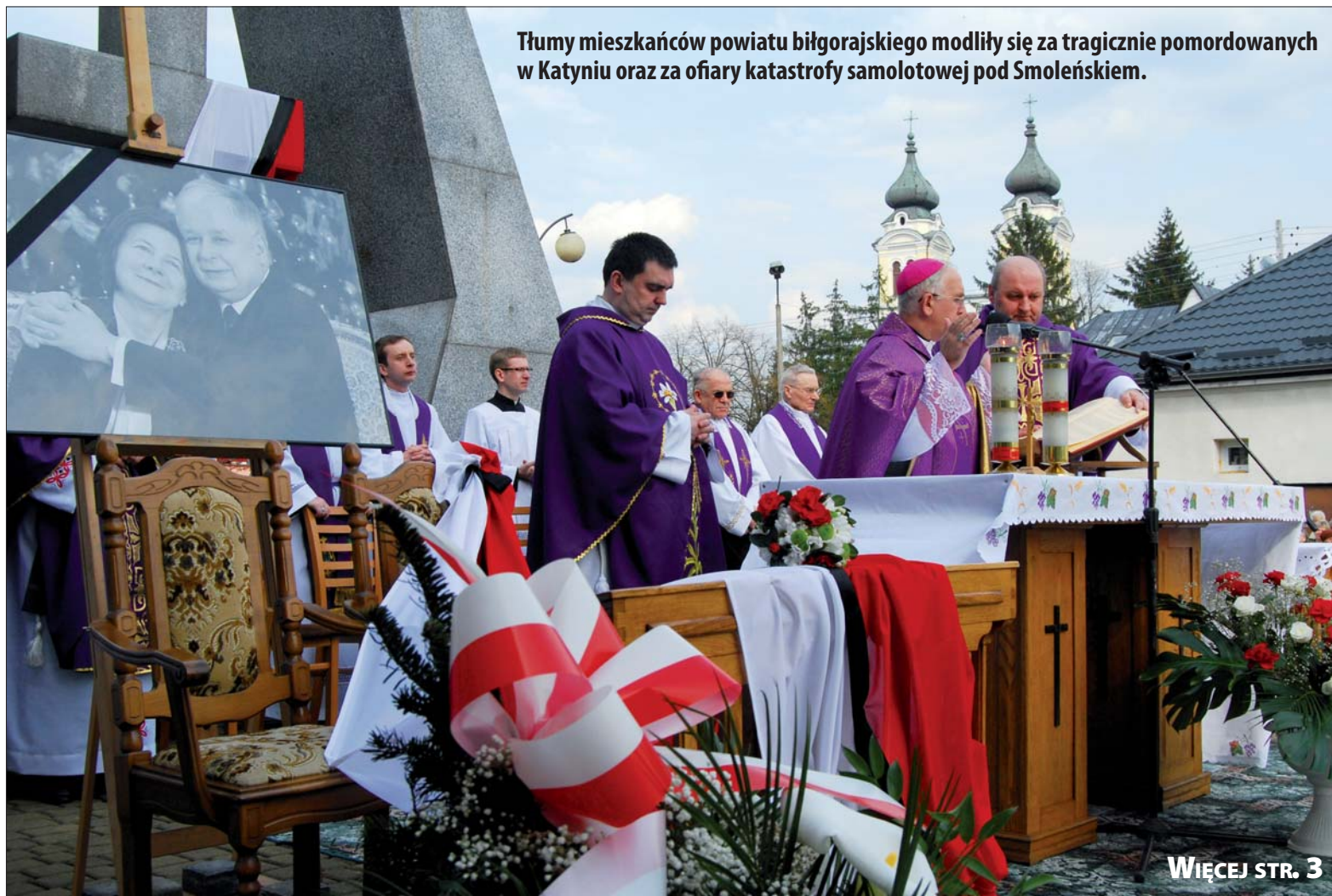
Tłumy mieszkańców powiatu biłgorajskiego modliły się za tragicznie pomordowanych w Katyniu oraz za ofiary katastrofy samolotowej pod Smoleńskiem.