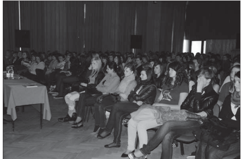
Uczennice z biłgorajskich szkół wysłuchały wykładu o profilaktyce chorób kobiecych.

Przyłączając się do tego apelu przypominamy, że takie badania można wykonać za darmo w Poradni Kobiecej w szpitalu w Biłgoraju.