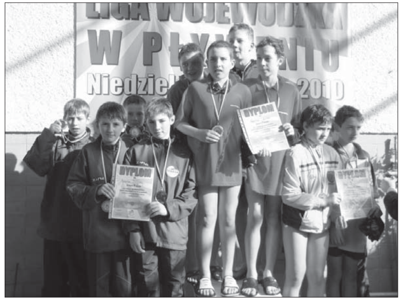
Pierwsza od lewej srebrna sztafeta RWKS Sparta