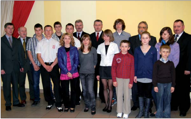
Na zakończenie była chwila na pamiątkowe zdjęcie

wygrwał stylem grzbietowym, motylkowym i dowolnym. W tych stylach osiąga wyniki, które plasują go w czołówce najlepszych zawodników w Polsce w swojej kategorii wiekowej.