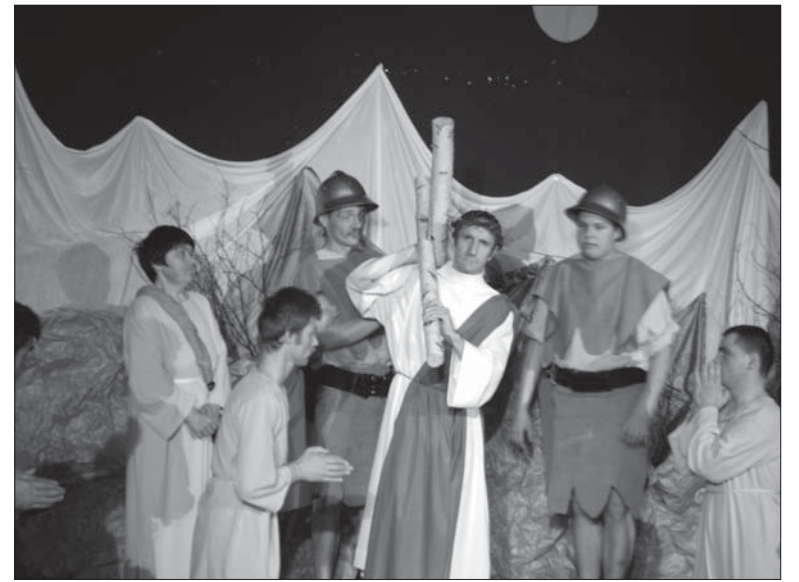
▶ Przedstawieniem bez słów aktorzy odtworzyli zdarzenia z ostatnich dni życia Chrystusa.

zejściem aktorów ze sceny, którzy podążyli za skazanym Chrystusem niosącym krzyż. Druga scena to Zmartwychwstanie. Muzyka towarzysząca wydarzeniom drugiej odsłony była spokojna, refleksyjna z przewijającą się pozytywną nutką. Po odsłonięciu kurtyny widzowie ujrzeli uczniów oplakujących śmierć swojego nauczyciela. W grocie, symbolizującej grób Chrystusa pojawiło się światło, czarne płótno zostało zastąpione białym. Zmartwychwstały Chrystus wymownym gestem budził zrozpaczonych, a zarazem zaskoczonych uczniów. Każdy z nich zaczął podążać za Chrystusem. W drodze, która była punktem finalnym drugiej sceny i odniesieniem do tytułu przedstawienia włączyli się