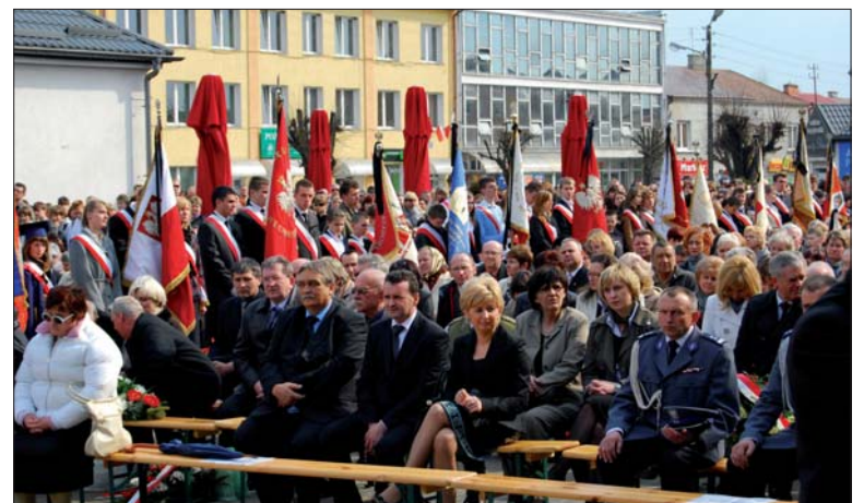
Za poległych w lasach katyńskich mieszkańcy naszego powiatu modlili się we wtorek, 13 kwietnia.

z życia do życia, tak dzisiaj już z Domu Ojca patrzy na nas i pomimo, że jeszcze oficjalnie nie jest ogłoszony świętym, to mamy prawo odwoływać się do niego jako przewodnika, w tej kolejnej stacji Golgoty, Golgoty Wschodu, dopisanej 10 kwietnia. Weszliśmy w tę stację poprzez dotknięcie w sercu katastrofą prezydenckiego samolotu. Przecież oni udawali się w drogę, aby zaświadczyć o prawdzie, o tej prawdzie sprzed 70 lat, która długo była zasypana w ziemi. Nie jest dzisiaj naszym zadaniem analiza przyczyn śmierci niewinnych ludzi, z których każdy miał swoje imię zapisane u Boga i w historii naszego narodu. Ale każda modlitwa musi opierać się na prawdzie, bo inaczej będziemy współuczestnikami współczesnych kłamstw, i wtedy nie będzie przyszłości. Każda nasza modlitwa, tak jak dzisiaj ta na rynku biłgorajskim, musi wypływać ze świadomości, że Bóg