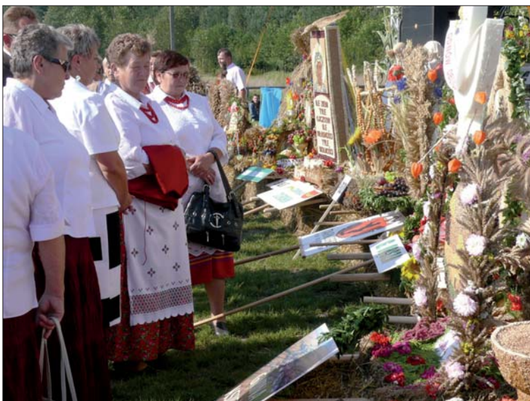
Pięknie wykonane wieńce dożynkowe zachwyciły niejednego.

ku szpitala. Taka forma daje nam gwarancję, że ten majątek nadal zostanie własnością powiatu. Ogłosiliśmy trzy przetargi. W wyniku tego postępowania wyłoniony został dzierżawca spółka Arion. Wszystko