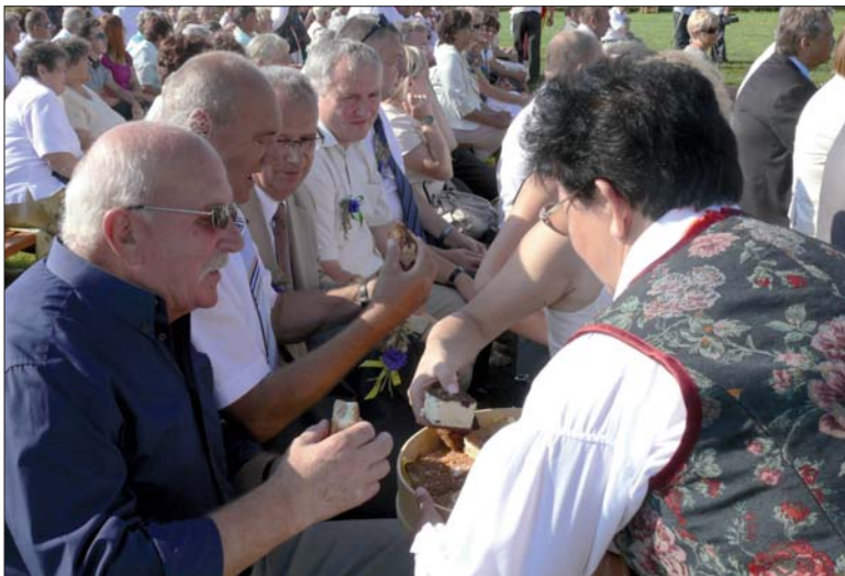
Podzieliliśmy się chlebem – jak w rodzinie.

- To był ostatni moment na podjęcie decyzji o ratowaniu naszego szpitala przed nieuchronną zapaścią. Naszym obowiązkiem było zrobić wszystko, aby przeszkodzić temu dalszemu zadłużaniu się. W tej sytuacji najbardziej bezpieczną formą było wydzierżawienie majątku