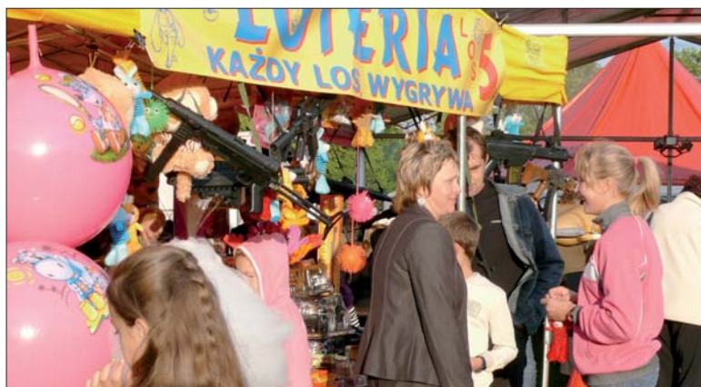
Loteria fantowa cieszyła się dużym powodzeniem.