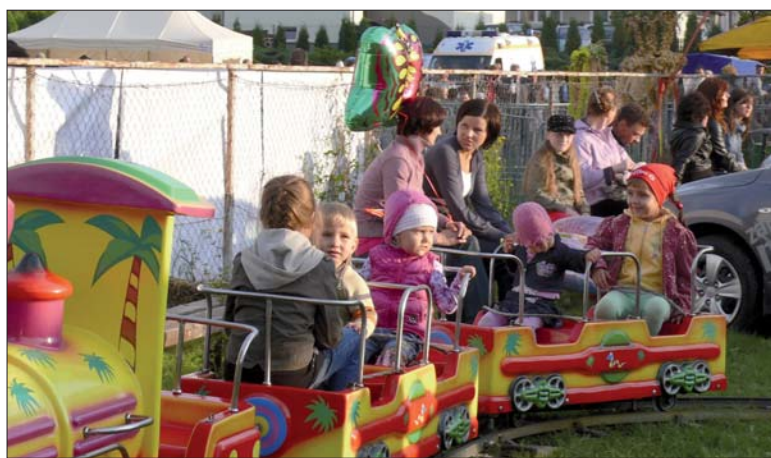
Najmłodszy mogli poszaleć na placu zabaw.