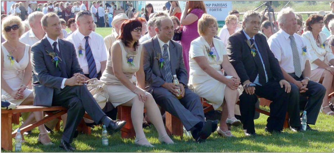
Samorządowcy również licznie wzięli udział w obchodach dożynkowych.