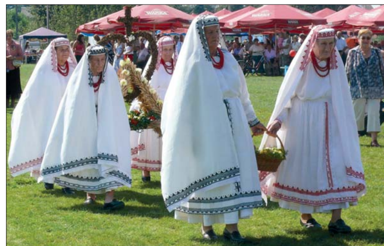
Członkinie Zespołu Śpiewaczego z Rudy Solskiej wystąpiły w tradycyjnych strojach biłgorajskich.

Władze powiatu zdecydowały o zmianie formy zarządzania. Nie ma żadnych indywidualnych spraw dla tego szpitala. Oświadczam wam to