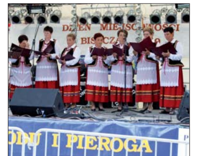
Jedną z atrakcji tegorocznych Dni Miodu i Pieroga były występy pań z gminnych kół gospodyń wiejskich.

Po oficjalnych wystąpieniach wszyscy chętni mogli degustować różne rodzaje pieroga i miodu, a także podziwiać wystawę sprzętu pszczelarstwa. W ramach imprezy zorganizowano także konkurs