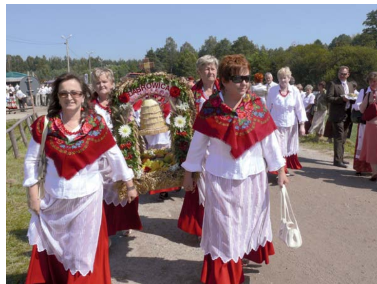
Każda większa miejscowość Gminy Biłgoraj przyniosła swój wieniec dożynkowy. Na zdjęciu korowód z Dąbrowicy.

On również przypomniał o najważniejszych zadaniach realizowanych przez powiat. Mówił tylko o największych zadaniach: o budowie boiska wielofunkcyjnego przy LO im. ONZ, remoncie basenu przy ZSBiO, modernizacji dachu na ZSZiO w Biłgoraju i Liceum w Turobinie oraz remoncie budynku internatu