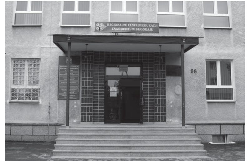
Podczas wakacji poprawiono schody przed głównym wejściem do RCEZ.

Także Młodzieżowy Dom Kultury w Biłgoraju przygotował się do nowego roku szkolnego poprzez wymianę centrali telefonicznej oraz okablowania na kwotę 3,5 tys. zł