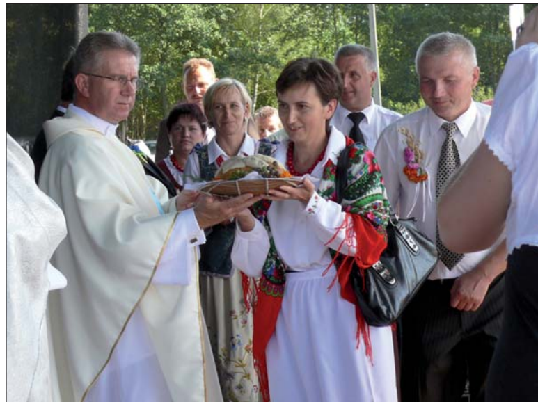
Dary ołtarza: m.in. chleb upieczony z tegorocznego ziarna.