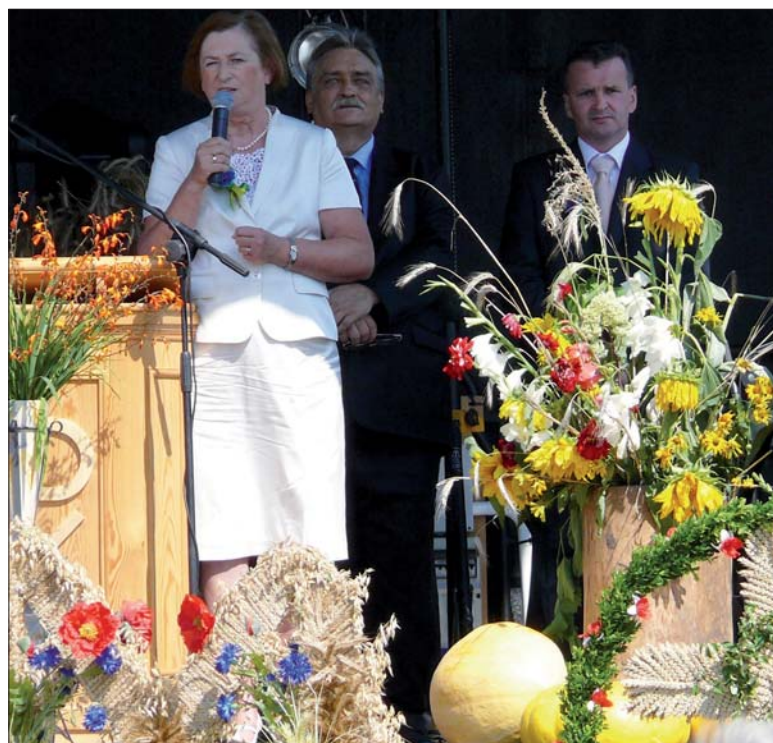
Wojewodzina porusza też temat przekształcenia szpitala w Biłgoraju.

- Diagnoza postawiona szpitalowi jest jedna. Jest to ogromnie zadłużony szpital. Dług przekroczył już wartość majątku. I nadal rośnie.