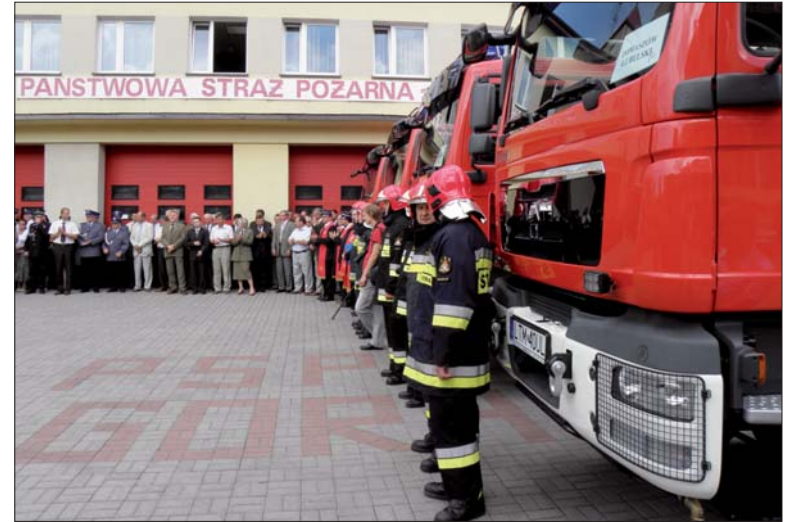
Biłgorajska komenda otrzymała ciężki samochód ratowniczo - gaśniczy, o wartości 850 tys. zł. również zaopatrzone w specjalistyczny sprzęt ochrony chemicznej i ekologicznej.

mln zł, co według wytycznych Regionalnego Programu Operacyjnego, stanowi 85% kosztów kwalifikowanych inwestycji. Ogólna wartość zrealizowanego projektu wyniosła ponad 3 mln zł.