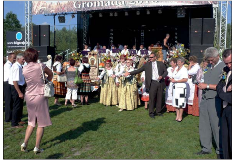
Starościna rzuciła ziarnem na szczęście.

dorabiać tu polityki. Życzę samorządowi powiatowemu, by dał radę rozwiązać ten problem.