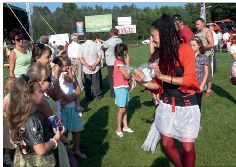
Najmłodszych zabawiali kolorowi klauni i ich pomocnicy.

Po tych wystąpieniach rozpoczęła się msza św. w intencji rolników.