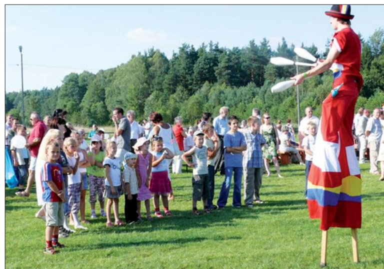
Występ klauna na szrudłach zachwycił najmłodszych uczestników dożynek.

Atrakcją wieczoru był koncert Kapeli Folkowej DREWUTNIA. Na zakończenie odbyła się zabawa taneczna z zespołem Solaris.