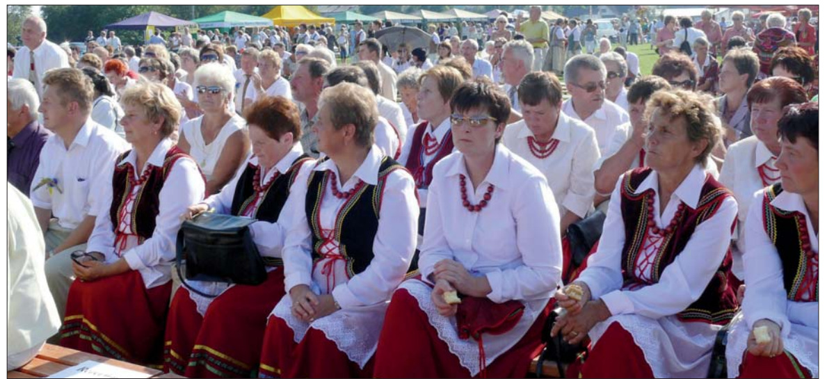
Na tegoroczne powiatowe obchody dożynkowe licznie przybyli mieszkańcy powiatu. Dopisała też pogoda.

Po wspólnej modlitwie rozpoczęły się prezentacje zespołów tanecznych i wokalnych. Rozpoczęła Biłgorajska Orkiestra Dęta im. Czesława Nizio z Biłgoraja. Następnie zaprezentowali się podopieczni Młodzieżowego Domu Kultury, a także zespoły folklorystyczne z terenu powiatu. W międzyczasie starościna dożynek sypnęła zbożem na szczęście, a wójt i starosta wręczyli upominki wszystkim przedstawicielom delegacji dożynkowych.