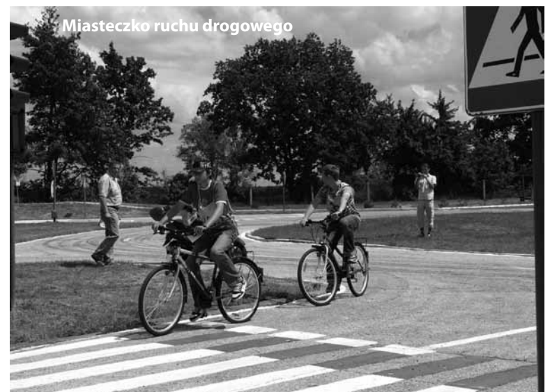
Miasteczko ruchu drogowego

Powiat w całości sfinansował wykonanie instalacji solarnej do podgrzewania wody basenowej i c.u.w. na krytej pływalni działającej