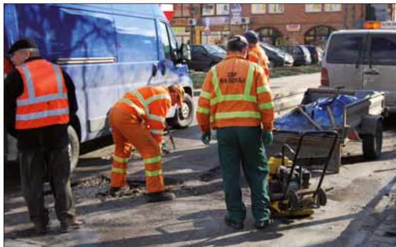
W 2009 roku nakłady na drogi powiatowe wyniosły prawie 10 mln zł.

wys. Zagrody Sitarskiej). Samorząd Biłgoraja wykonał dokumentację techniczną budowy ul. Korczaka (od ul. Polnej do Parkowej wraz z odwodnieniem i oświetleniem). Wykonano również roboty remontowo – wzmocnieniowe na ul. Batorego na odcinku o dł. 200 m. Środki na ten cel pochodzą z budżetu powiatu. W