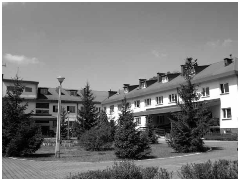
Prace poprawiające gospodarkę ciepłą zakończą się w 2011 r.

Starostwo Powiatowe w Biłgoraju poprawia gospodarkę ciepłą w Domu Pomocy Społecznej w Teodorówce. Realizacja tej inwestycji przebiega wieloetapowo i powinna zakończyć się w 2011 r. Zadanie kosztowało 86 115 zł, z czego 20 000