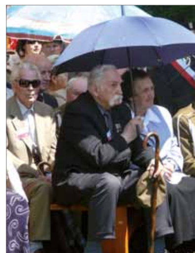
nizowany w Zamościu, Starosta Biłgorajski i Wójt Gminy Łukowa.

Organizatorem spotkania są: Wojewódzki Komitet Ochrony Pamięci Walk i Męczeństwa w Lublinie, Światowy Związek Żołnierzy AK Okręg Zamość, Ogólnopolski Związek Żołnierzy BCH, 3 Batalion Zmecha-