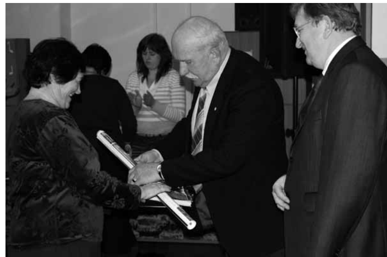
W tym roku święto twórców kultury obchodziliśmy 18 października.