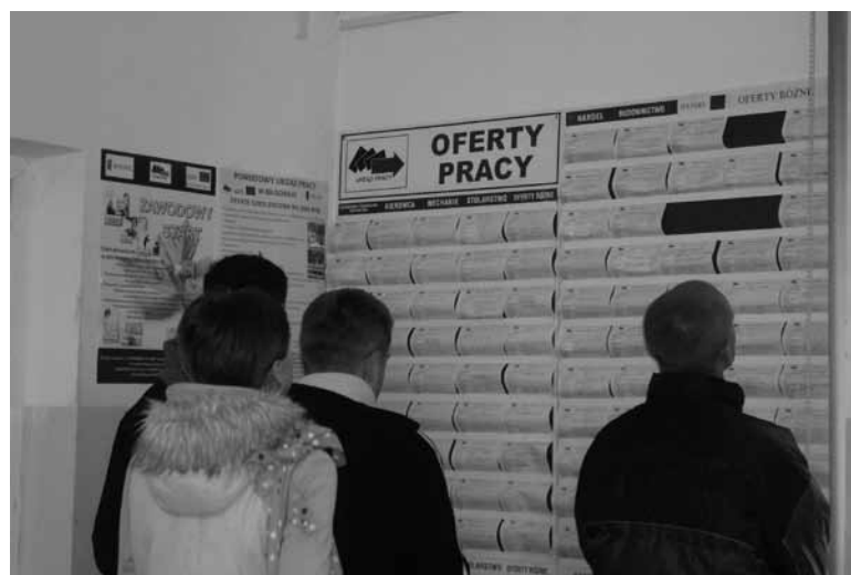
Poziom bezrobocie w naszym powiecie zaliczany jest do jednego z najniższych w województwie.

Program „Wiosenne porządki” – aktywizacja zawodowa osób bezrobotnych mająca na celu pobudzenie aktywności zawodowej i pomoc w powrocie na rynek pracy. Beneficjentami były kobiety w wieku powyżej 45 lat znajdujące się w szczególnej sytuacji na rynku pracy. 23 osoby zostało skierowane do pracy w ramach robót publicznych po szkoleniu z zakresu aktywnego poszukiwania pracy. Realizacja: 15.04.2010r.