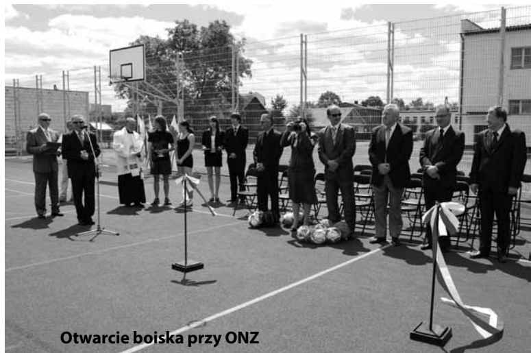
Otwarcie boiska przy ONZ

wykonano remont placu szkolnego. Ułożono nowy dywanik asfaltowy. Zadanie kosztowało ponad 60 000 zł. Sfinansowane zostało przez Powiat Biłgorajski. Plac wykorzystywany jest na wszelkiego rodzaju uroczystości związane z funkcjonowaniem szkoły, ale przede wszystkim przeznaczony jest do parkowania pojazdów.