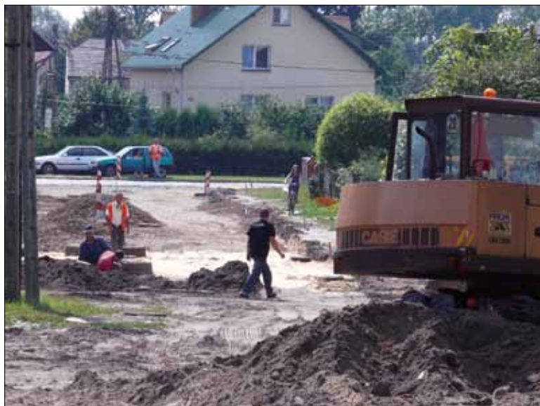
Dzięki współpracy samorządów Miasta Biłgoraj i Powiatu udało się zrealizować kolejne kilometry dróg w mieście.

Za 710 tys. zł wykonane zostały prace budowlane na drogach powiatowych w gminie Biłgoraj. Wszystko dzięki porozumieniu jakie zawarte zostało pomiędzy Zarządem Powiatu, a samorządem Gminy Biłgoraj, który na prace na drogach powiatowych przekazał 440 tys. zł. Resztę dołożyło ZDP. Za te pieniądze wykonane zostało dalsze odwodnienie