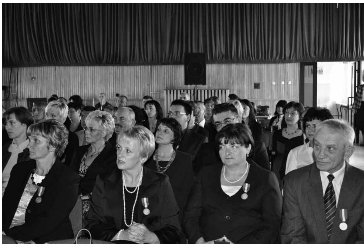
Podczas jubileuszu pracownicy PUP zostali odznaczeni za wzorową pracę.

czasowej działalności Powiatowego Urzędu Pracy w Biłgoraju. W tym celu przygotowano specjalną prezentację i film, które pokazywały początki funkcjonowania urzędu i zmiany jakie w nim zaszły na przestrzeni ostatnich 20 lat. Sobotnia uroczystość była także okazją do składania życzeń i gratulacji. Za profesjonalizm i zaangażowanie w