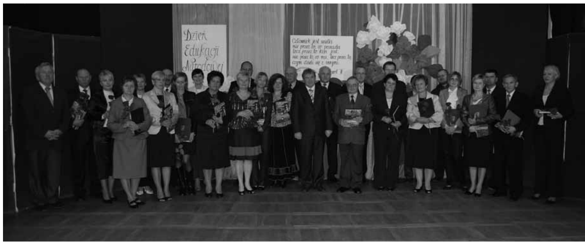
Pamiątkowe zdjęcie tegorocznych odznaczonych z przedstawicielami władz powiatu.