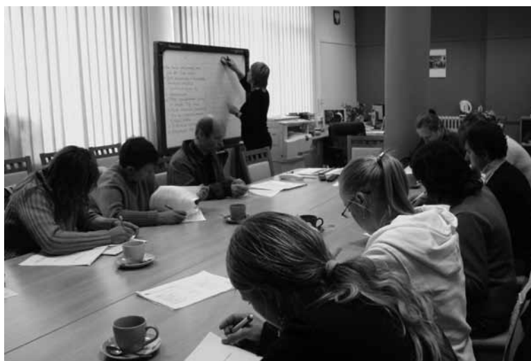
Chętnych do korzystania z programów realizowanych przez nasz urząd pracy nie brakuje.

Powiatowa Rada Zatrudnienia jest organem opiniotwórczo-doradczym starosty w sprawach polityki rynku pracy. Liczy 13 członków. Są to przedstawiciele organizacji związkowych, pracodawców, społeczno-zawodowych organizacji rolników, jednostek samorządu terytorialnego oraz organizacji pozarządowych zajmujących się statutowo problematyką rynku pracy.