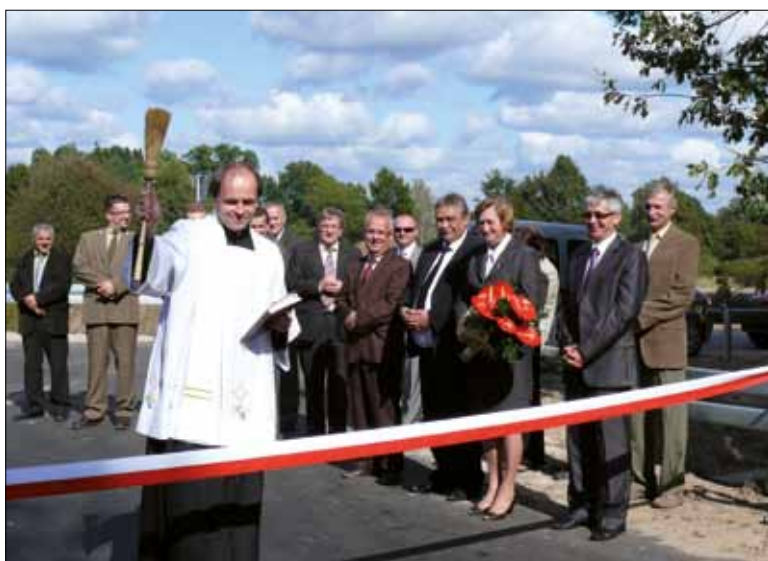
Uroczyste przecięcie wstęgi i poświęcenie nowej drogi Bidaczów – Wólka Biska.

Miejscowości Bidaczów Stary (znajduje się w gminie Biłgoraj) i Wólka Biska (znajduje się w gminie Biszczka) łączy droga powiatowa o dł. 4326 mb. Budowa tej trasy ma wieloletnią historię. Pierwszą część