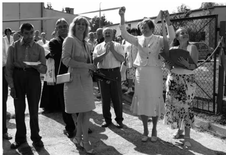
W uroczystym przecięciu wstęgi uczestniczyli przedstawiciele władz wojewódzkich, powiatowych oraz mieszkańcy Domu.

Powiatowego Funduszu Ochrony Środowiska i Gospodarki Wodnej