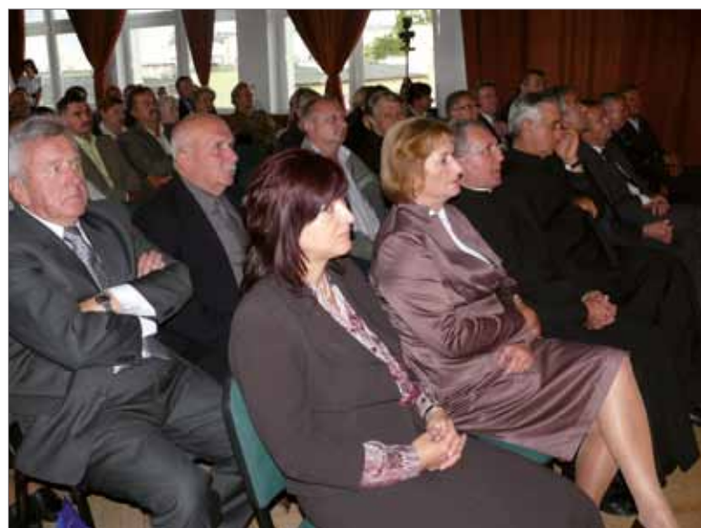
W obchodach jubileuszowych udział wzięli działacze Solidarności i samorządowcy z województwa lubelskiego i powiatu biłgorajskiego.