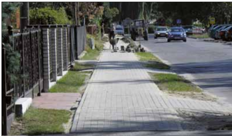
Nowy chodnik przy ul. Polnej.

Gmina Księżpól: w gminie Księżpól wykonano roboty remontowo – wzmocnieniowe na trzech