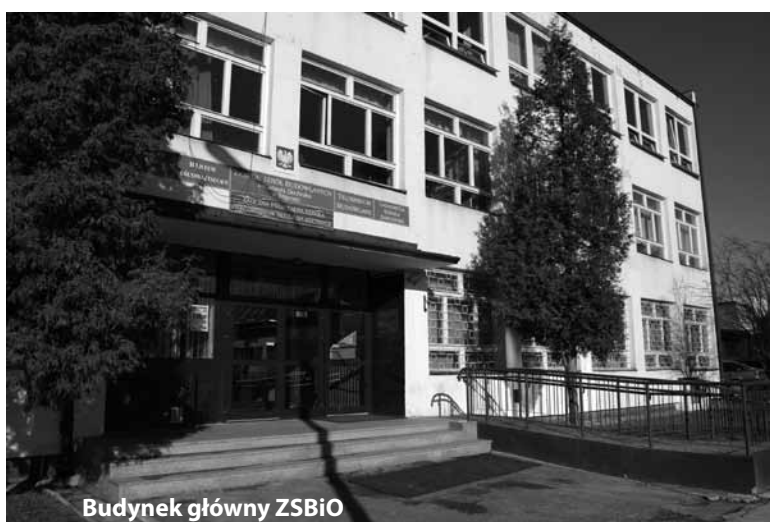
Budynek główny ZSBiO

W Zespole Szkół Zawodowych i Ogólnokształcących w Biłgoraju