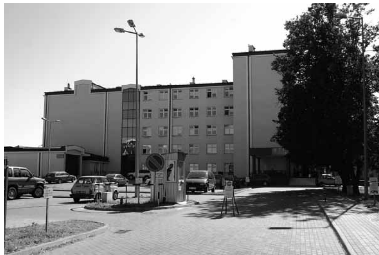
Od 7 października szpitalem kieruje spółka Arion.

Do 31 grudnia 2010 trwał będzie proces likwidacji SP ZOZu. W procesie likwidacji wymagane jest m.in. sporządzenie wykazu wszystkich wierzycieli oraz potwierdzenie sald wierzycielskich na dzień rozpoczęcia likwidacji oraz sporządzenie bilansu otwarcia. Jest to długi proces i wymaga szczególnej dokładności. Często wymaga dodatkowych uzgodnień i potwierdzonej korespondencji. Sporządzenie wykazu wierzycielskich konieczne jest do określenia wysokości zobowiązań, które zostaną przejęte przez powiat biłgorajski. Zmiana terminu zakończenia likwidacji wiąże się również z możliwością spłaty zobowiązań SP ZOZ w likwidacji przez