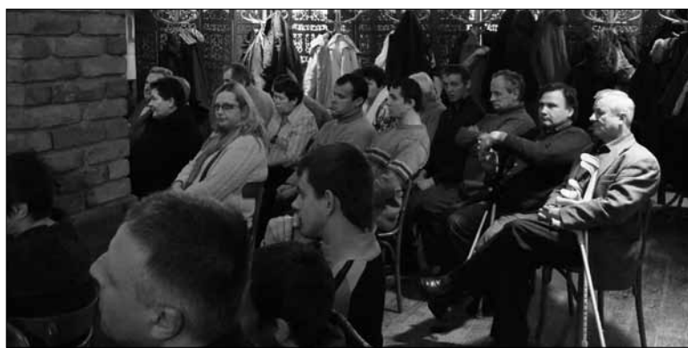
Kilkadziesiąt osób podniosło swoje kwalifikacje zawodowe.

Z wszystkimi beneficjentami zawarto umowy oraz indywidualne programy usamodzielnienia, w których określono konkretne działania do wykonania, tzw. „ścieżkę reintegracji”, uwzględniającą indywidualne potrzeby i predyspozycje