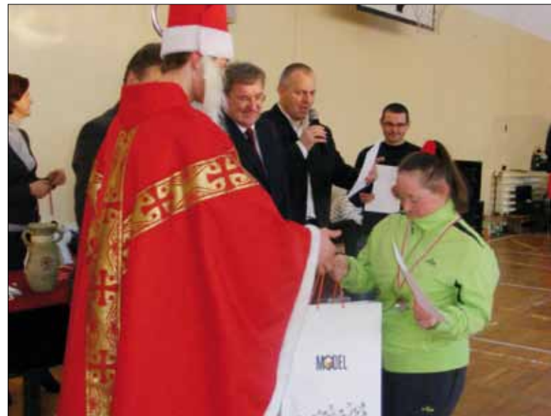
Uczestników turnieju odwiedził też Św. Mikołaj.