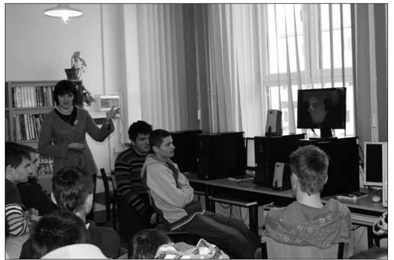
Uczniowie RCEZ podczas jednej z prelekcji dotyczącej raka szyjki macicy.

Pomoc w tym ma zwiększenie wiedzy na temat profilaktyki raka, poznanie roli wirusa, czynników zwiększających ryzyko zachorowań i motywowanie do regularnych badań profilaktycznych. „Rak szyjki Macicy jest drugim, co do częstości wystę-