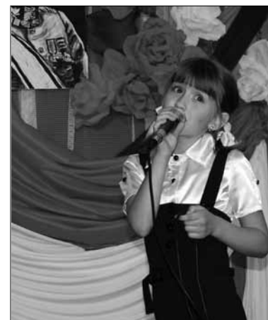
Uczniowie przypomnieli jak to kiedyś o wolności się śpiewało.