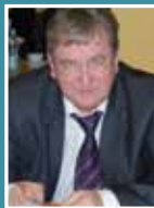
Wicestarosta Stanisław Schodziński