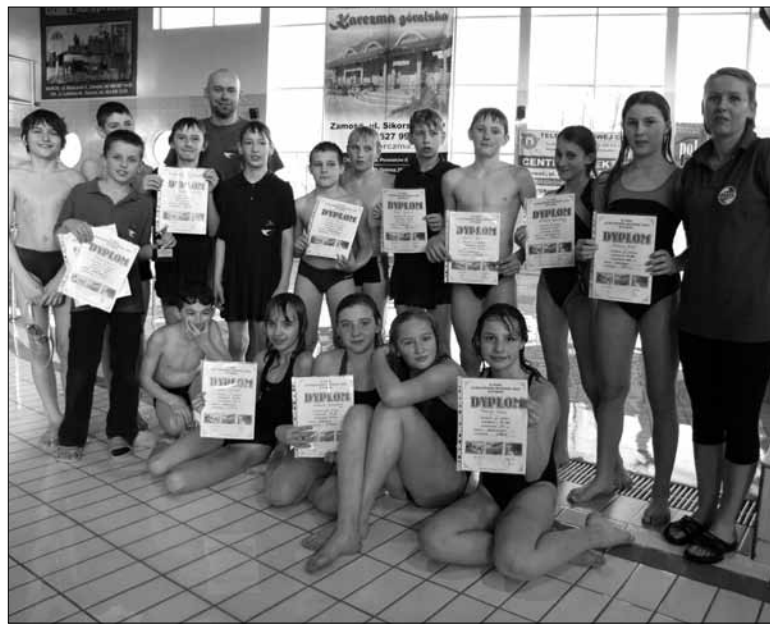
Wszyscy nasi pływacy i pływaczki zasługują na wyróżnienie za wolę walki i poprawione rekordy życiowe.

Podnoszenie ciężarów: XX edycja Challenge „Złotej sztangi”