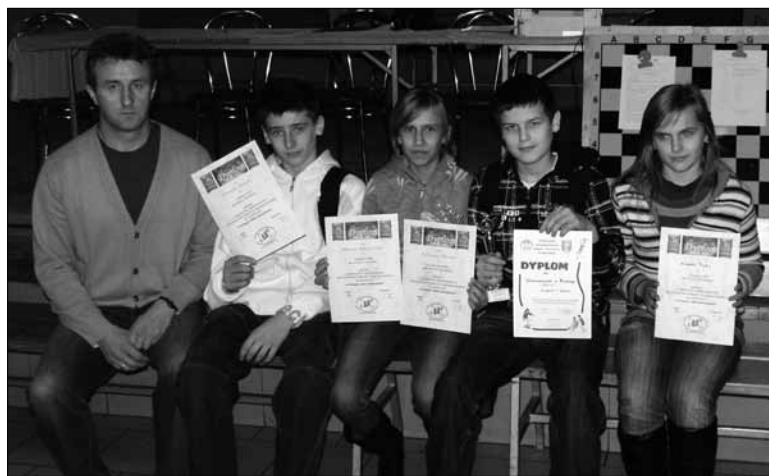
Niepokonani okazali się gimnazjaliści z Biszczy.