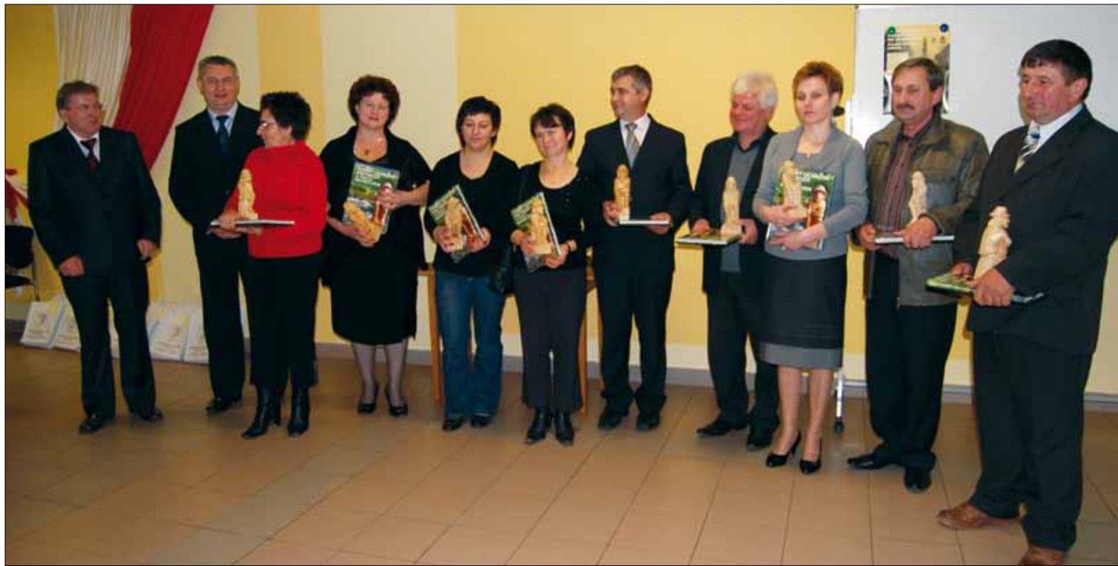
Pamiątkowe zdjęcie wszystkich tegorocznych odznaczonych.

Firma stale poprawia jakość świadczonych usług, o czym świadczą szkolenia pracowników w profesjonalnych ośrodkach dla cukierników oraz wdrożony system HACCP, który pozwala na szczegó-