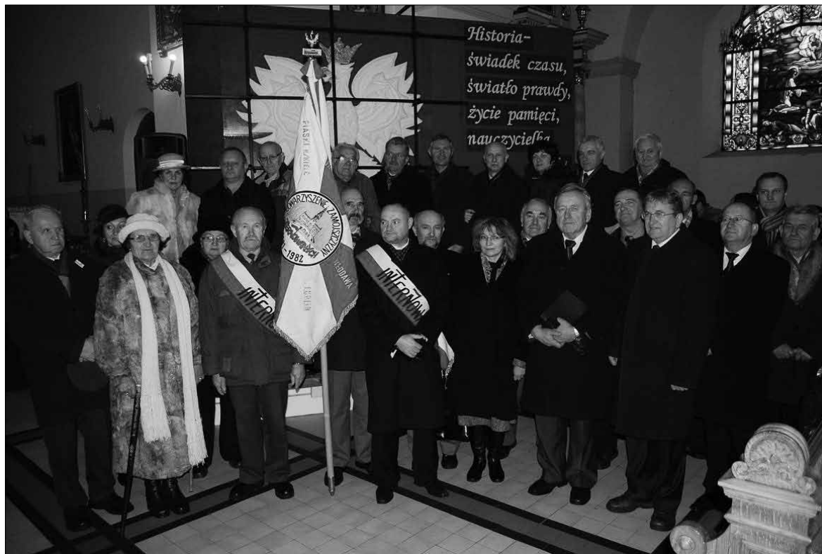
W tym roku świętowaliśmy 29. rocznicę wprowadzenia stanu wojennego w Polsce.

„Niech nasza droga będzie wspólna. Niech nasza modlitwa będzie pokorna. Niech nasza mi-