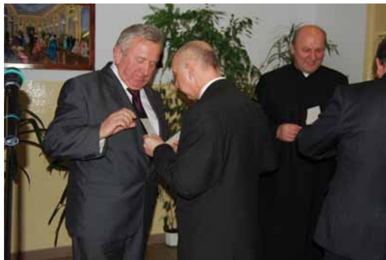
Na pierwszym planie podczas łamania się opłatkami Starosta oraz Przewodniczący Rady.

- Pragnę serdecznie podziękować wszystkim tym, którzy pracowali na rzecz powiatu biłgorajskiego oraz tym, którzy swoją pracą i postawą wspomagali innych. Patrzymy z optymizmem i nadzieją w nadchodzący