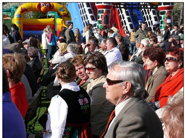
Festyn akcji „Pomóż szpitalowi”

Zbiórka potrwa do 30 czerwca. 2007 r. Pieniądze można wpłacać na konto w Banku Spółdzielczym Oddział Biłgoraj na nr 46 9602 0007 0014 1178 2000 0001.