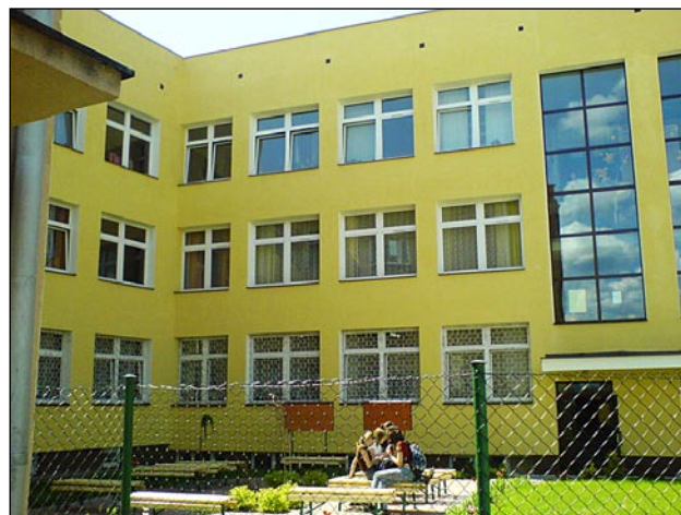
Modernizacja budynku ZSO w Biłgoraju