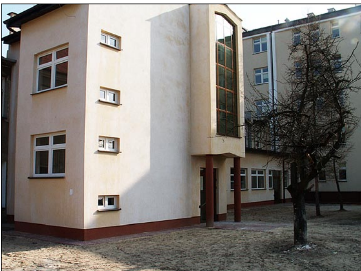
Nowo powstały łącznik komunikacyjny pomiędzy częścią nową a starą szpitala