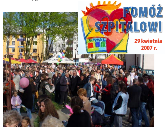
Festyn akcji „Pomóż szpitalowi”

dialny nad akcją objęli: Biłgorajska Telewizja Kablowa, Dziennik Wschodni, NOWa Gazeta Biłgorajska i Kronika Tygodnia.