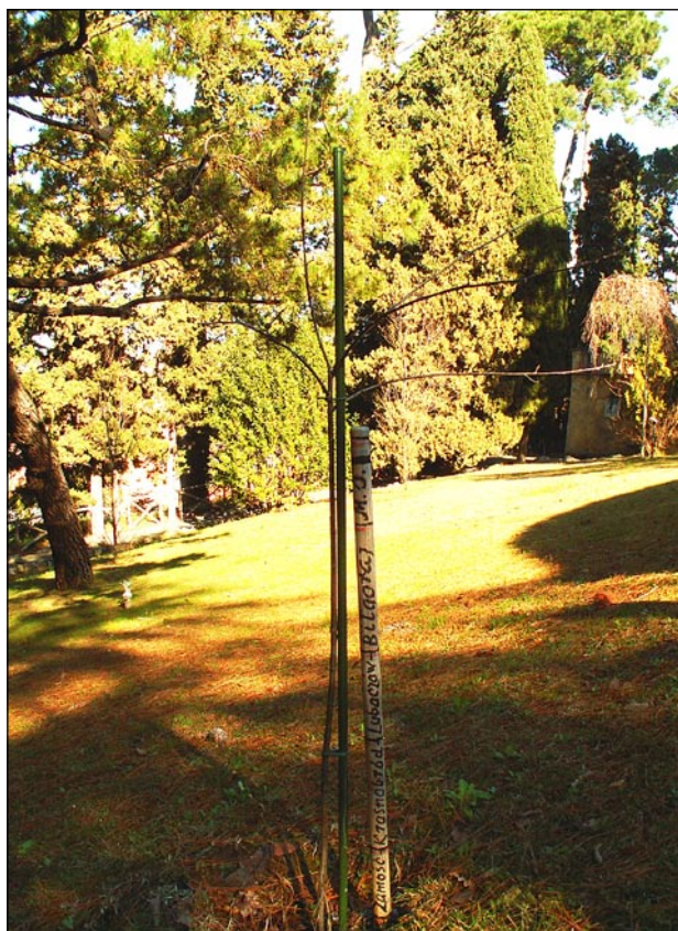
Dąb im. Jana Pawła II posadzony w 2005 przez Kapitułę „Dziedzictwo Narodu Święta Sprawa” w Ogrodach Watykańskich, przy Alei Matki Bożej Czuwającej – miejsce gdzie często przebywał nasz rodak Jan Paweł II. Zdjęcie z 2006 roku.

Szanowni Mieszkańcy Ziemi Zamojsko – Lubaczowskiej