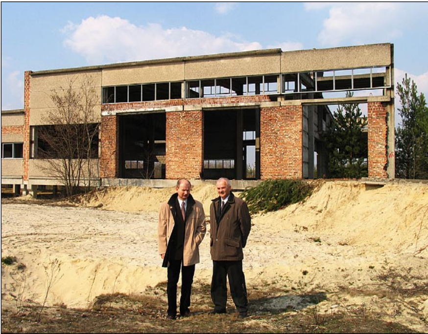
Koordynatorzy działań mających na celu utworzenie SSE

Specjalna Strefa Ekonomiczna jest to wyodrębniona administracyjnie część terytorium Polski, przeznaczona do prowadzenia działalności gospodarczej na korzystniejszych warunkach. Korzyści prowadze-