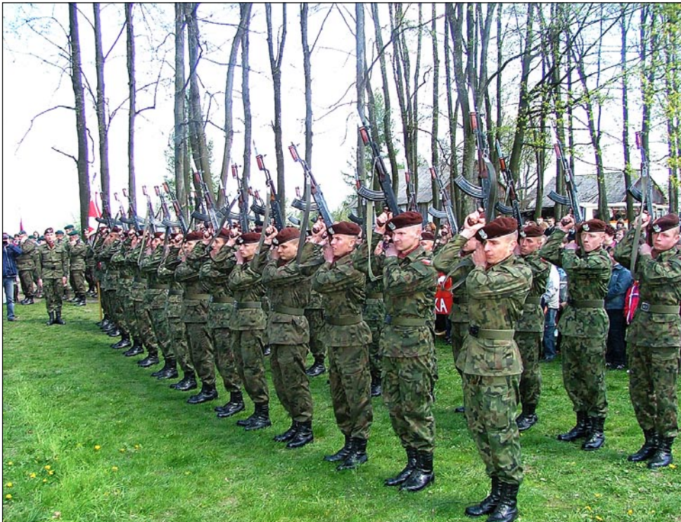
Salwa honorowa żołnierzy Wojska Polskiego 3 Brygady Obrony Terytorialnej w Zamościu.