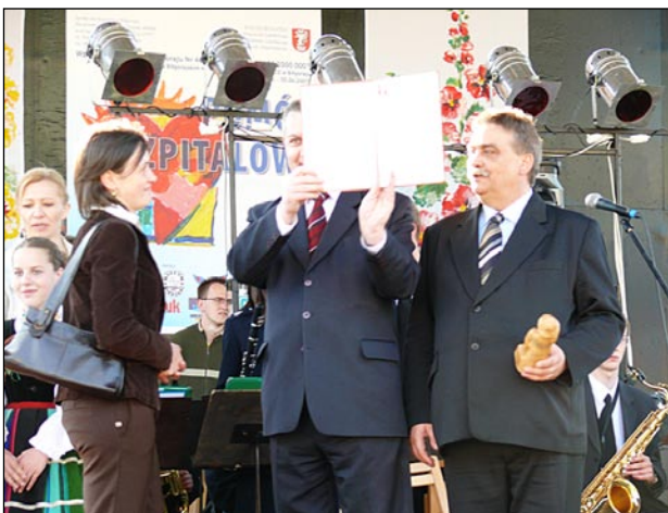
Wręczenie nagród w konkursie „Nasze Biłgorajskie 2007”

Konkurs ma na celu wyróżnienie i promocję firm działających na terenie Powiatu Biłgorajskiego reprezentujących ponadprzeciętny i godny naśladowania poziom. Konkurs jest wyróżnieniem najciekawszych inicjatyw i projektów promujących przedsiębiorczość, wyróżnieniem dobrych praktyk, który pomoże samorządowi powiatowemu w integracji środowiska gospodarczego koniecznego przy realizacji rozwoju społeczno - gospodarczego. Konkurs adresowany jest do wszystkich firm działających na terenie Powiatu Biłgorajskiego, niezależnie od charakteru własności zakładu pracy, jego wielkości czy liczby zatrudnionych pracowników. Kandydatów do konkursu mogły zgłaszać osoby prawne takie jak podmioty gospodarcze, organizacje, instytucje, stowarzyszenia a także samorządy. Dokonując wyboru 15 firm, kapituła konkur-