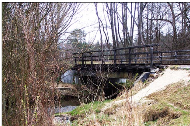
Most Osada Głuchy