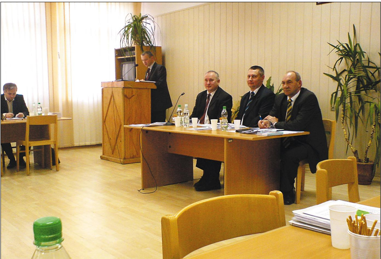
Prezydium Rady Powiatu w Biłgoraju

Ze względu na zbyt małą ilość wykonywanych procedur w tych oddziałach i wiążących się z tym niskich przychodów podjęliśmy decyzję o ograniczeniu działalności tych oddziałów. Wypracowują one dochód wystarczający wyłącznie na wynagrodzenia personelu tam pracującego. To wynika z wyliczeń z ostatnich miesięcy – tłumaczył dyrektor Kowal. Likwidacja jest nieunikniona. Jednak pacjenci nie powinni się niczego obawiać. Oddział ginekologiczny będzie zlikwidowany, ale zachowane zostaną łóżka ginekologiczne. Nadal funkcjonował będzie oddział położniczy – wyjaśniał dyrektor – Pododdział ortopedyczny również będzie zlikwidowany, podobnie jak w przypadku ginekologicznego, zachowane zostaną łóżka urazowo-ortopedyczne na oddziale chirurgicznym. W miejsce zli-