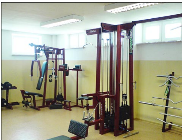
Siłownia w ZSZiO w Biłgoraju